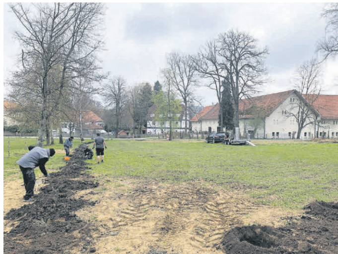
Die Arbeiten am Gutenzeller Spielplatz haben begonnen.